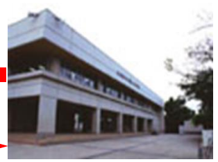
春日部市立大增中

小中一貫推進委員会 (市教育委員会指導主事・両校校長・教頭 教務主任・研修主任)