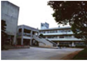
春日部市立立野小

小中一貫教育を推進し、9年間を見通した一貫した指導を行い地域に誇れる学校、地域に誇れる児童・生徒の育成を目指していく。(トップの教育を目指す)